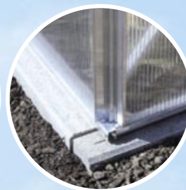
solidna podstawa, mocne profile podłogowe