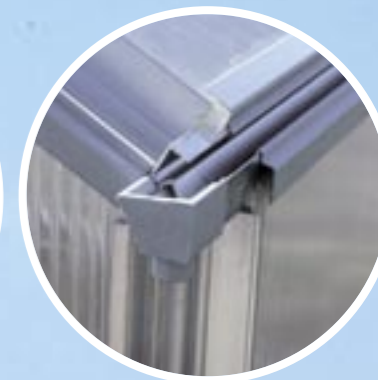
rynna z króźcem